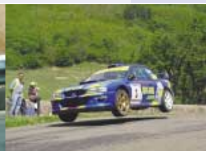
▲ Rallye de Mâcon