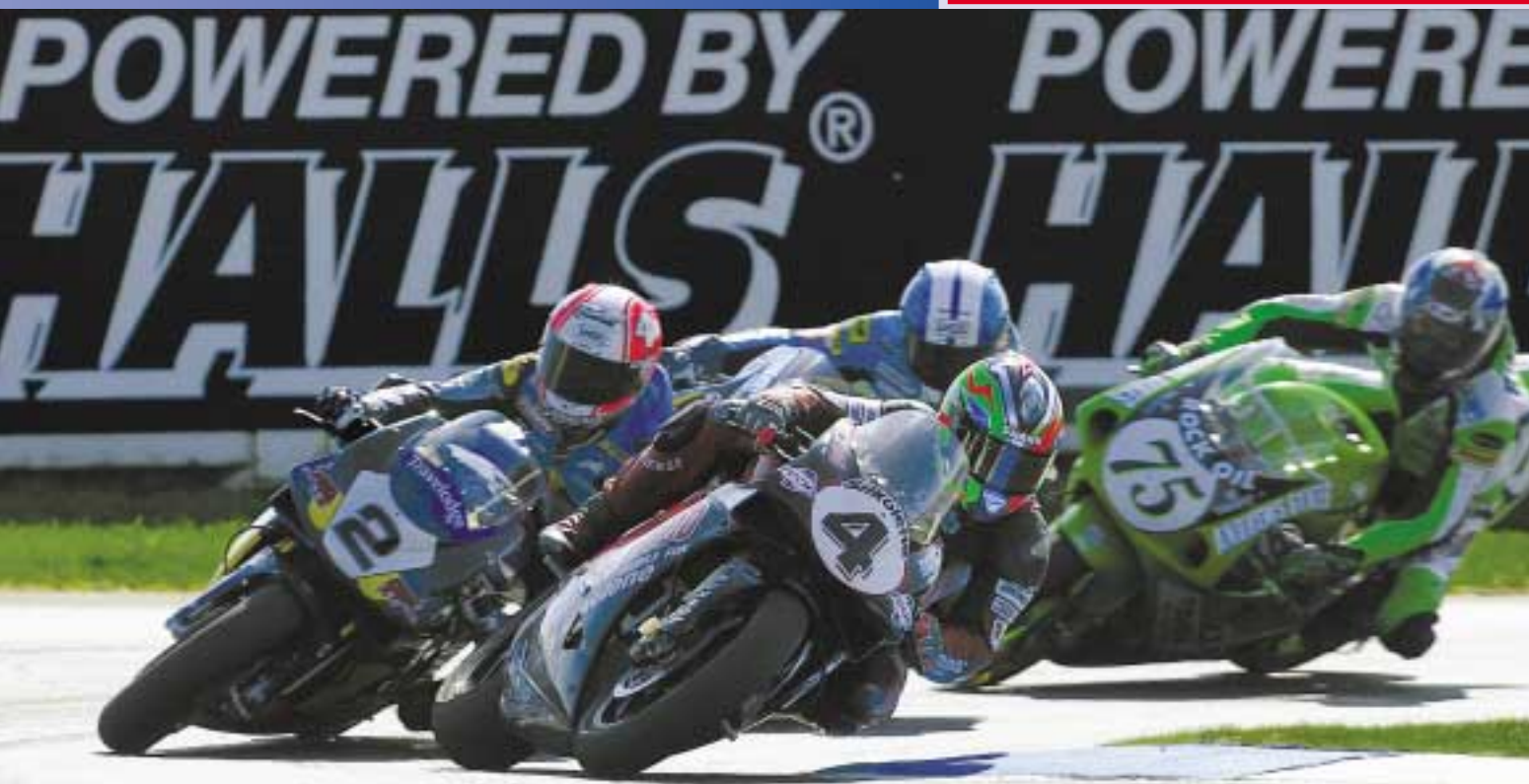
Zwei Runden vor Ende geht der Silkolene Nr. 4 Fahrer in Führung.